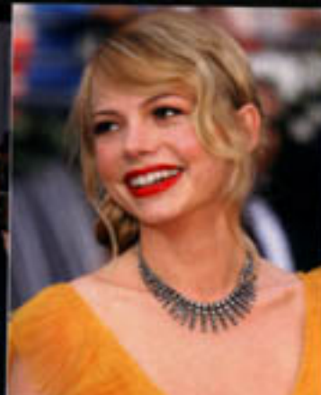
Charlize Theron, Schmuck: Chopard, Nicole Kidman und Michelle Williams, beide mit Schmuck von Fred Leighton