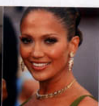
Jennifer Aniston, Schmuck: Bulgari, wireimage. Jennifer Garner, Schmuck: Cartier, Paris Hilton in der „Acquifer Suite“ bei der Schmuckanprobe von DTC. Jennifer Lopez, Schmuck: Fred Leighton, ganz rechts