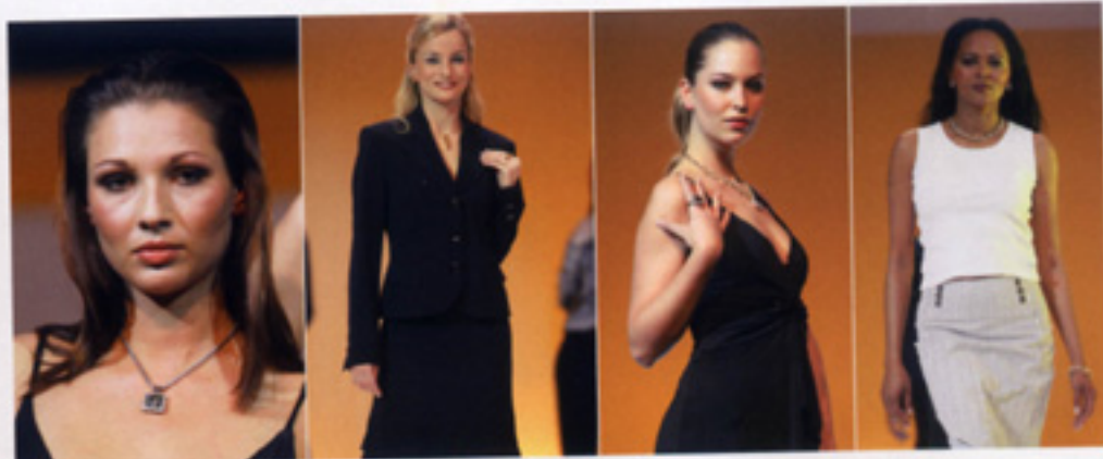
Auf der Trendshow setzten Pforzheimer Hersteller wie A&Z, Bunz, Cédé, IsabelleFa, Leo Wittwer und andere Schmuck mit Mode in Szene