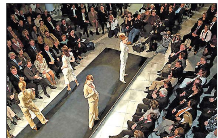
Emotionen wecken – was die Models auf dem Laufsteg zeigten, hatte bei vielen Trendshow-Gästen die Lust auf Luxus neu belebt.

So kann eine Trendshow sogar förderlich fürs Miteinander von Paaren sein. Es müsste mehr davon geben. Der heimischen Traditionsindustrie wäre dann auch geholfen. Thomas Kurtz