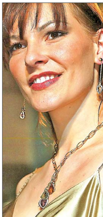
Ketten bringen Farbe ins Spiel – als Träger von spannungreich kombinierten Schmucksteinen.